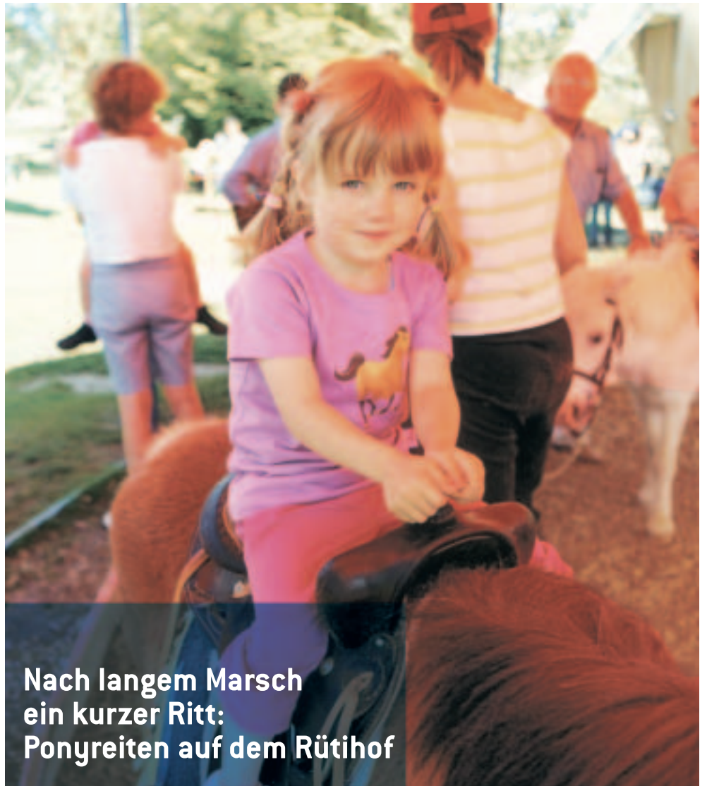
Nach langem Marsch ein kurzer Ritt: Ponyreiten auf dem Rütihof

Kinder dürften es allerdings nicht lange auf den Stühlen aushalten. Kaum haben sie ihre Portion